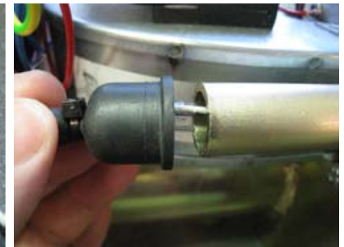
6. Aseta leikinvalvoja paikoilleen metalliputkeen.