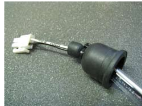
5. Suojakumi on oltava vedettyä kiinni lasiputkeen.