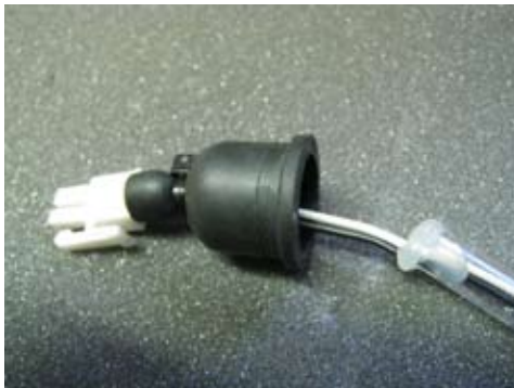
4. Ennen paikalleen asennusta on tarkistettava että suojakumi ei ole liukunut johdossa väärään paikkaan.