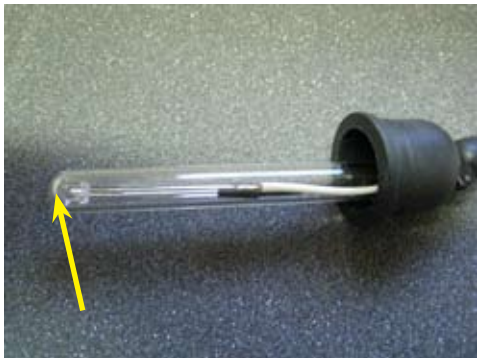
3. Puhdista liekinvalvojan lasiputki epäpuhtauksista. Erityisesti liekinvalvojan kärki on oltava puhdas.