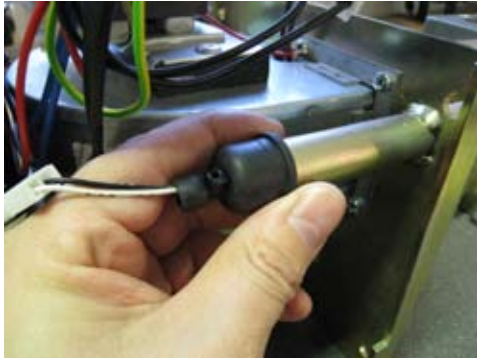
1. Irroita liekinvalvoja paikaltaan vetämällä kumisuojuksesta ulospäin.