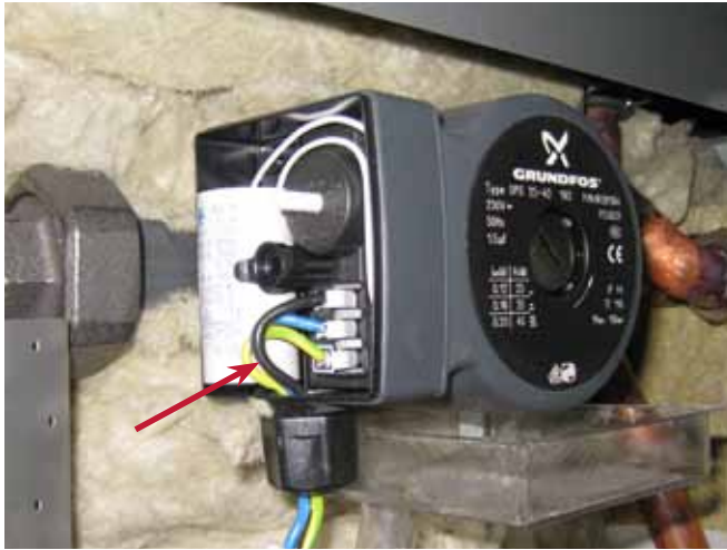
6. Irroita kiertovesipumpun suojakansi ja johdot.