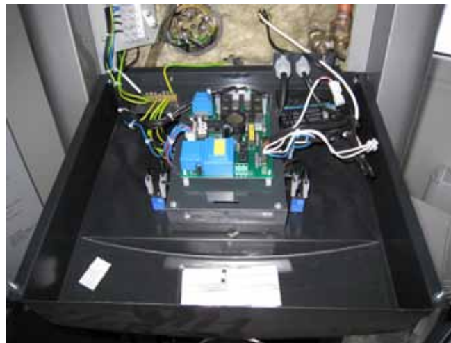
10. Ohjauspanelin kasaaminen tapahtuu päinvastaisessa järjestyksessä.