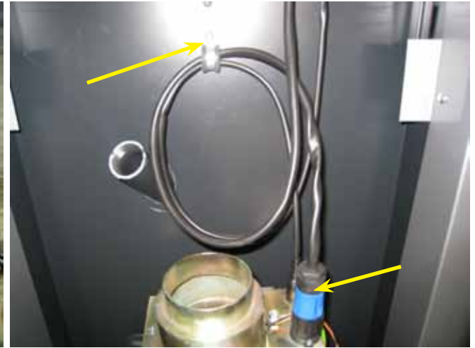
8. Irroita panelin johtojen kiinnitys kattilasta ja liittimet polttimesta.