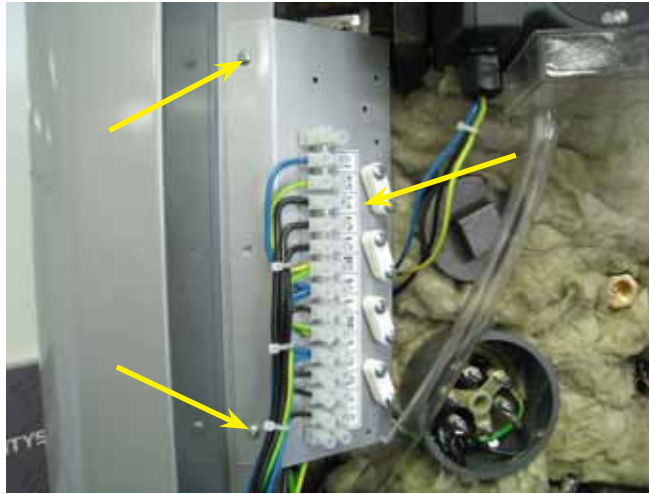
7. Irroita syöttöjohdot ruuviliitimeltä (ei kuvassa) ja irroita ruuviliitinpanelin kiinnitysruuvit.