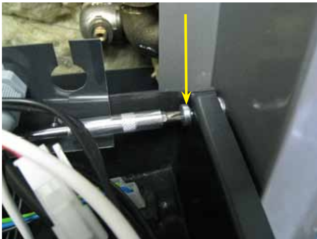
9. Irroita panelin saranaruuvit molemmista alareunoista.